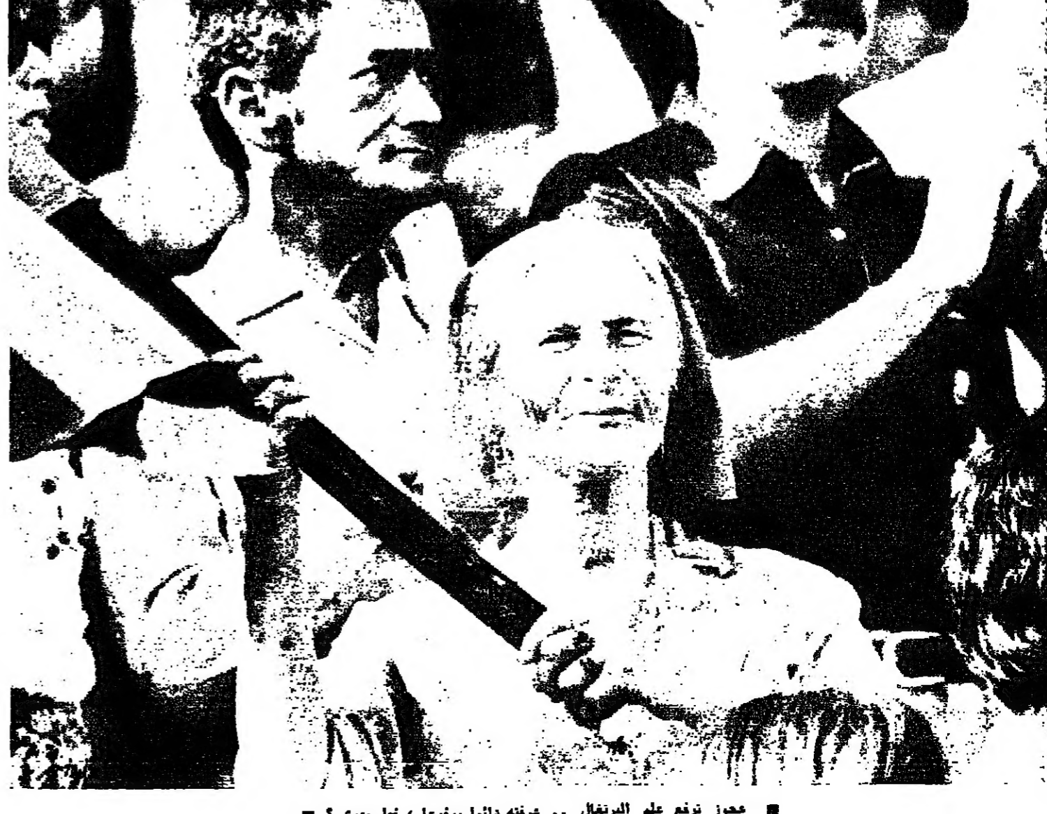
■ عجوز ترفع علم البرتغال .. غرخته دائما مرفوعا ، قبل يهوى ؟